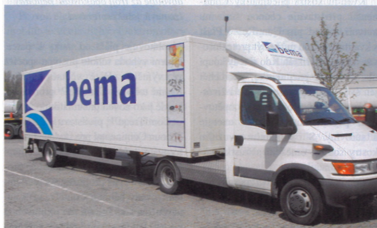
Lehká návěsová nástavba z hliníkové konstrukce zatěžuje jízdní soupravu minimálně a nabízí velký nákladový prostor

203,2 mm. Všechny ocelové díly mají povrchovou úpravu zinkováním.