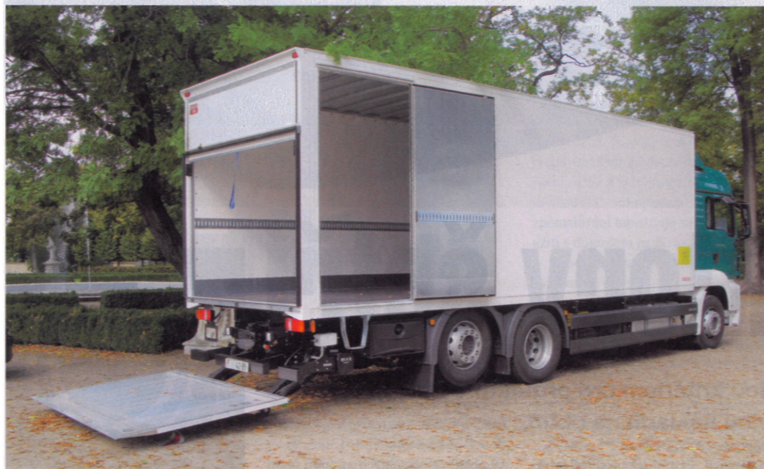
Výška zadní klapky a umístění bočních dveří dle přání zákazníka