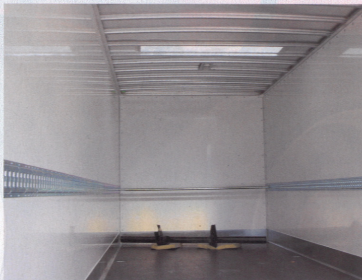
Vnitřní prostor návěsu FRP může být například vybaven okopovým plechem, univerzálními lištami a světlíkem

Pro všechny typy vozidel a návěsy zejména pro střední až těžké náklady slouží skříňové prostory s překližkovými stěnami. Ty tvoří oboustranně