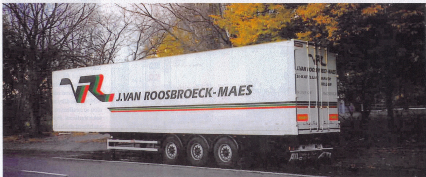
Návěs FRP v dlouhém provedení 13,6 m poskytuje vnitřní prostor 95 m 3

s okopovým plechem, různými typy vnitřního obložení a upínacích lišt, s hliníkovým nebo polyesterovým převísem. Zadní rám lze získat pozinkovaný či nerezový, standardní nebo paletový, s jedno, dvou, tří či čtyřkřídlymi dveřmi, případně klapkou nebo roletou.